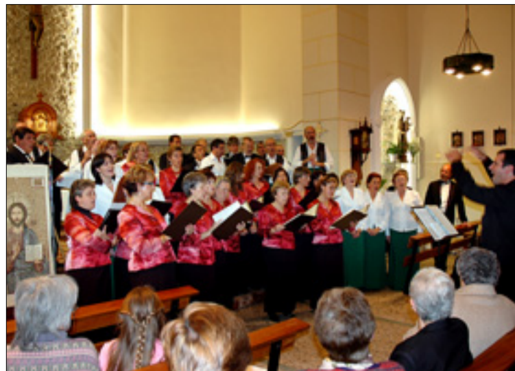
Un momento del concierto ofrecido por la coral madrileña.

R.- Es muy difícil conseguir una agrupación de este tipo, ¿qué más quisiéramos nosotros que tener varias escolanías, una, por ejemplo, el Coro Los Templarios y otra la Coral Santa María.